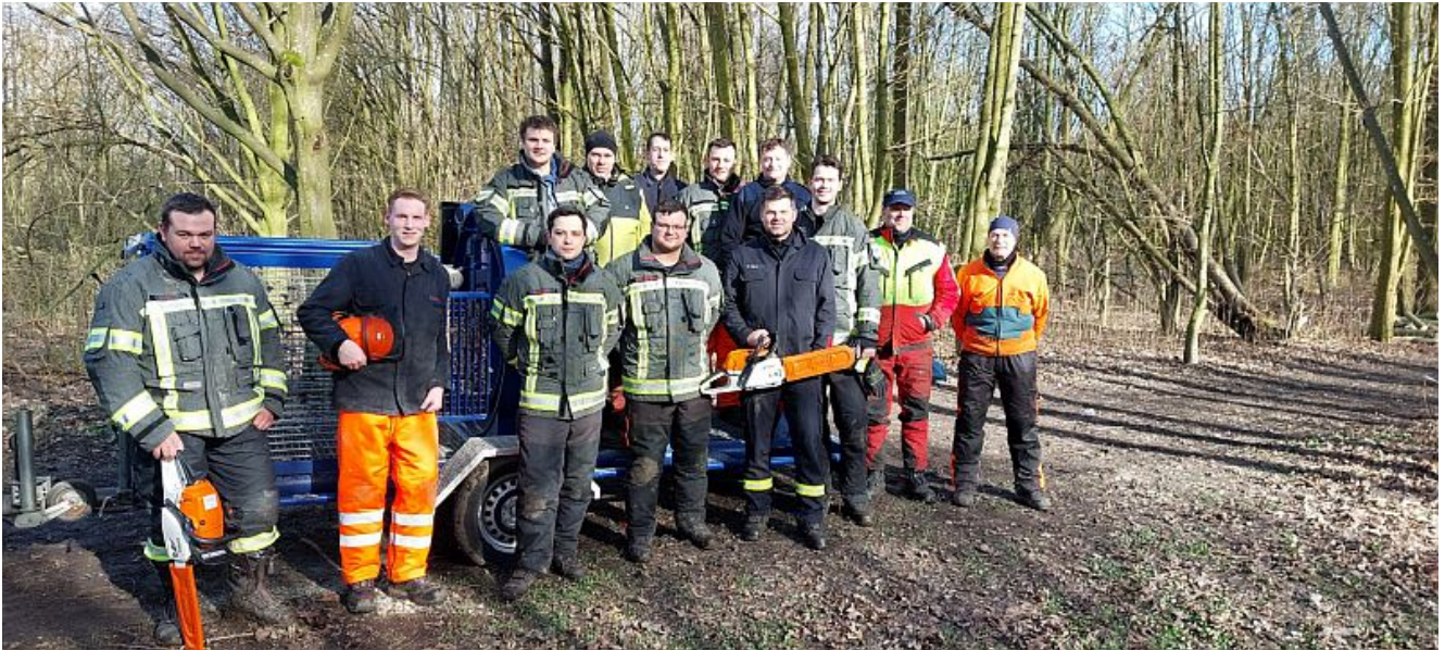
Die gesamte Truppe des Lehrgangs.

Am gestrigen Samstag hieß es „Achtung, Baum fällt“ in einem Waldstück in Hamm Bockum-Hövel. Eine Woche vorher lernten die Teilnehmer alle theoretischen Grundlagen zum Bedienen einer Motorkettensäge. Dann ging es diesen Samstag an die praktische Ausbildung der Motorkettensäge.