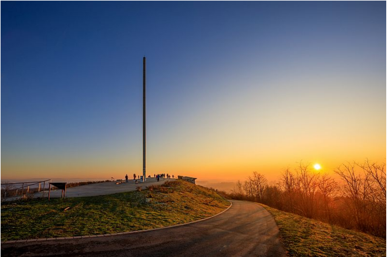
Sonnenuntergang auf der Halde Großes Holz.

Es gibt in ganz Bergkamen – und der Region – wohl keinen schöneren Ort, um den sommerlichen Sonnenuntergang zu sehen. Genießt dieses Ereignis an einem der längsten Tage des Jahres – und bekommt dazu noch viele Infos rund um die Entstehung der Halde.