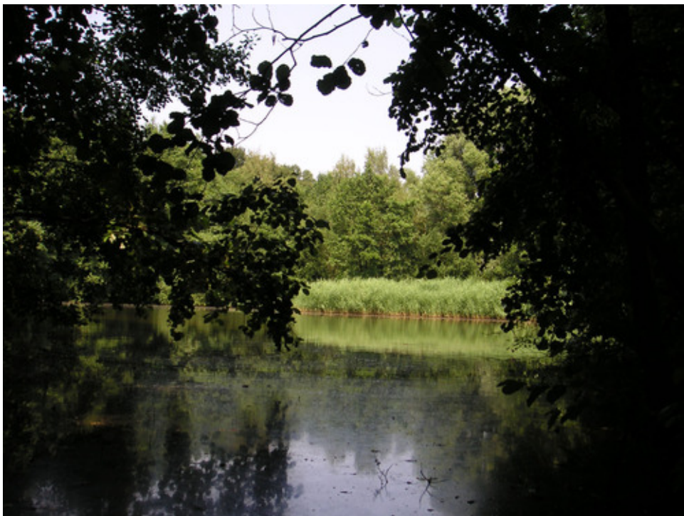
Gewässer im Mühlenbruch.