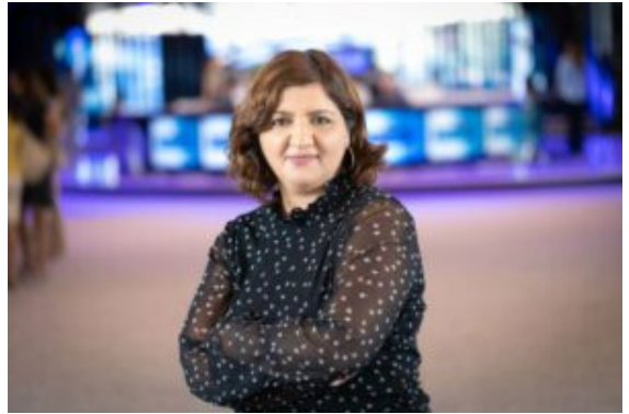
Özlem Alev Demirel.

Die Feuertaufe des neu formierten Kreisverbandes der Partei Die Linke wird der Wahlkampf für die Europawahl 2024, der für Die Linke insgesamt unter schwierigen Vorzeichen stattfindet. Dennoch stellte der Kreisverband bei einer Mitgliederversammlung einen ausführlichen Wahlkampfplan auf. In den letzten Wochen wurde dieser durch die Verantwortlichen finalisiert und ein Wahlkampfteam gegründet. Dieses besteht aus deutlich mehr Leuten als zuerst gedacht. Zuletzt nahmen die Sprecher:innen des Kreisverbandes an einer Videokonferenz des Landesverbandes NRW teil, insgesamt zeigt sich ein positives Bild des Wahlkampfes, auch in anderen Kreisverbänden.