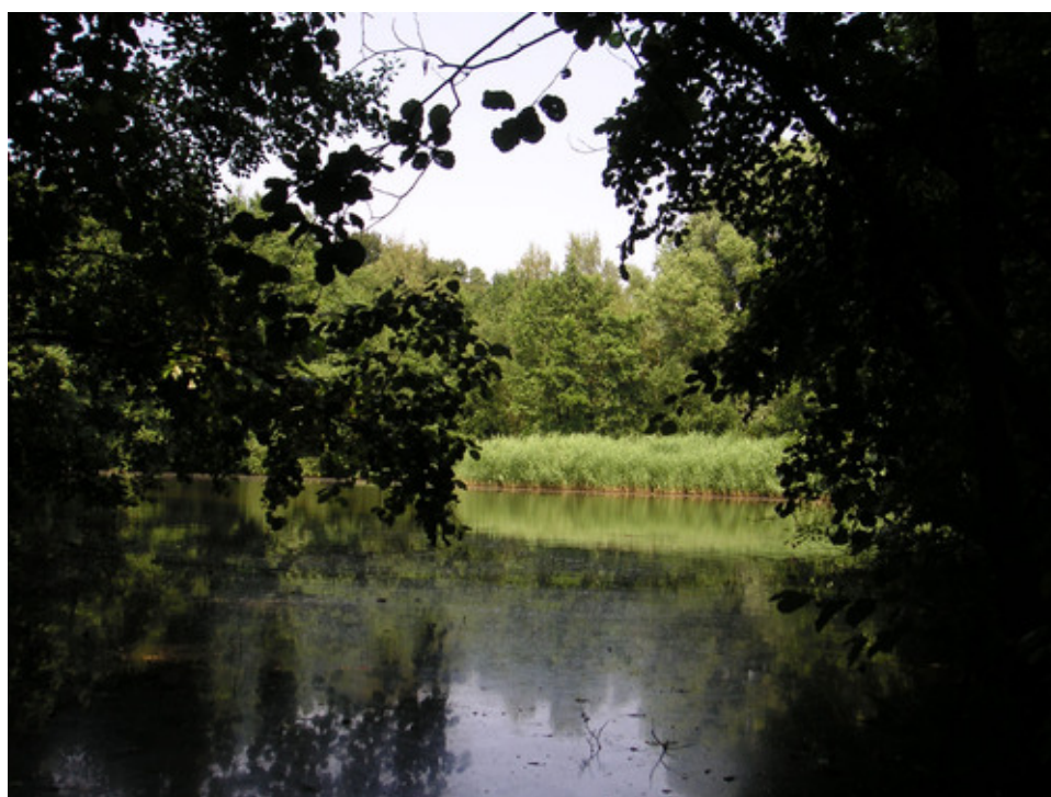
Gewässer im Mühlenbruch.