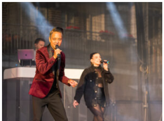
Musik und Tanz samt DJ gab es auf der Hauptbühne.

Der Fahrradparkplatz war schon fast bis an die Kapazitätsgrenze gefüllt. Auch zu Fuß strömten unablässig die Besucher Richtung Hafensperrmauer. Ganze Pilgerscharen waren auf allen Straßen rundherum unterwegs. Mit Kinderwagen und Hunden an der Leine ging es auf die beiden Plätze der Marina, wo sich der Sommer endlich mal wieder von seiner überaus freundlichen Seite zeigte. Ein gelungener Auftakt für das, was noch zwei Tage lang folgen soll.