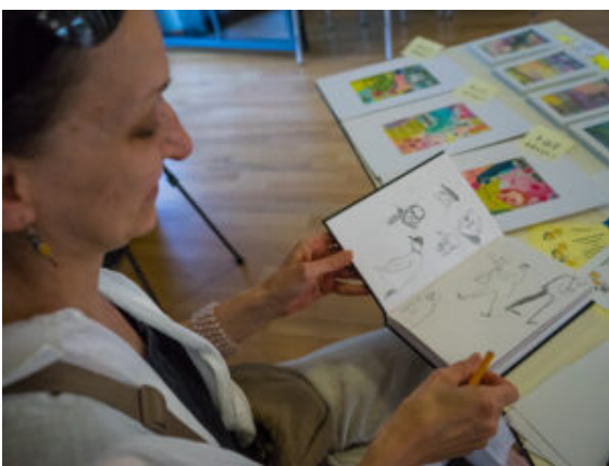
Ein Blick in das Zeichenbuch einer Künstlerin im Trauzimmer.

Die Erfrischung konnten auch alle gebrauchen, die sich auf dem Platz am Pier 47, Hafencafé und Marina Event beim Bierfest auf den Rücken des üppigen Bullen wagten. Der wartete mit feurig roten Augen auf „Opfer“, die er in verschiedenen Geschwindigkeitsstufen herumwirbeln konnte. Das Tier war zum Glück aus Plastik und sein Temperament bestimmte ein simpler Knopfdruck. Fest stand: Niemand kletterte von seinem Rücken, sondern flog am Ende. Wie lang man sich halten konnte, hing von den körperlichen Fähigkeiten und der Menge des konsumierten Alkohols ab.