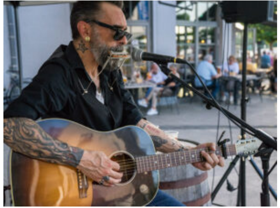
Musikalische Untermalung für Rodeo und Meer beim Bierfest.

Die Erfrischung konnten auch alle gebrauchen, die sich auf dem Platz am Pier 47, Hafencafé und Marina Event beim Bierfest auf den Rücken des üppigen Bullen wagten. Der wartete mit feurig roten Augen auf „Opfer“, die er in verschiedenen Geschwindigkeitsstufen herumwirbeln konnte. Das Tier war zum Glück aus Plastik und sein Temperament bestimmte ein simpler Knopfdruck. Fest stand: Niemand kletterte von seinem Rücken, sondern flog am Ende. Wie lang man sich halten konnte, hing von den körperlichen Fähigkeiten und der Menge des konsumierten Alkohols ab.