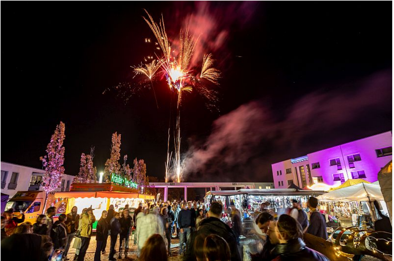
Feuerwerk vom Marktdach beim 22. GSW-Lichtermarkt.