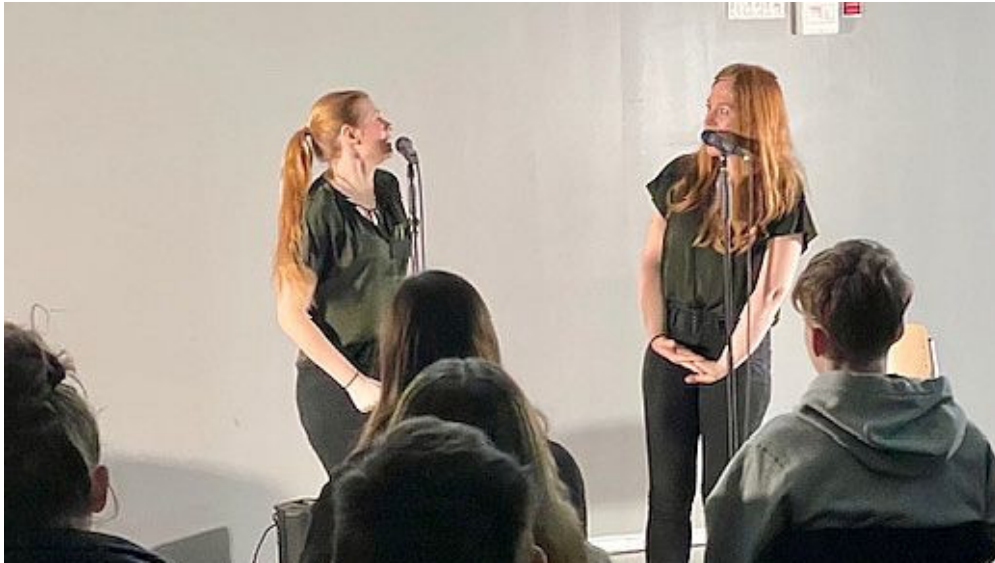
Aufklärungstheater „Brechreiz“ zum Thema Essstörungen.

Am Donnerstag fand für den gesamten 9. Jahrgang ein Aufklärungstheater mit dem Titel „Brechreiz“ an der Willy Brandt Gesamtschule statt, das von der Schulsozialarbeit organisiert wurde. Die finanzielle Unterstützung kam von der Mobil-Krankenkasse im Rahmen des Projektes „Bauchgefühl“. Ziel der Veranstaltung war es, die Schülerinnen und Schüler für das wichtige Thema ‚Essstörungen‘ zu sensibilisieren und aufzuklären.