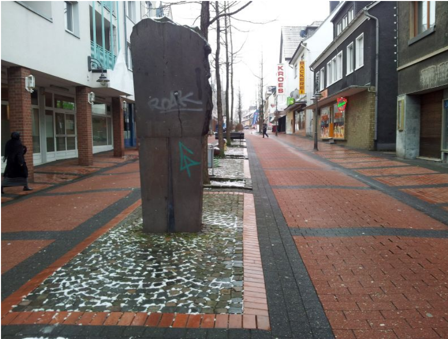
Nordberg - Fußgängerzone

Längst nicht besänftigt sind die Gemüter hingegen, die sich über die beiden Filme erregt hatten, die im RTL-Magazin „Extra“ über den Nordberg zu sehen waren. Niemand vermochte, in den Beiträgen „sein“ Bergkamen widerzuerkennen. Außerhalb der Stadtgrenzen wird aber dieses schiefe Bild für bare Münze gehalten. Wie er es habe zulassen können, dass in seiner Stadt kaum noch ein Deutscher wohne, musste Schäfer in einem der zahlreichen Briefe und Mails lesen, die nach der Sendung im Rathaus eingegangen sind.