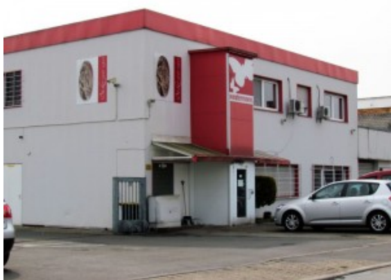
Bäckerei Westermann in Oberaden.