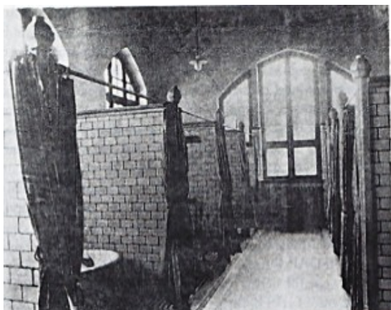
Waschkabinen im Wohlfahrtsgebäude

dank seiner hervorragenden Verbindungen zum preußischen Innenminister Göring und zu dessen Polizeiführung im Ruhrgebiet und Rheinland gesorgt.