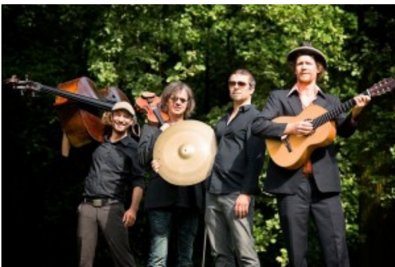
Wuppinger Orchestre l'Europa