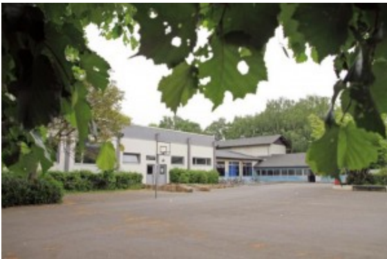
Ehemalige Heideschule in Weddinghofen.

Die ehemalige Heideschule an der Berliner Straße in Weddinghofen war über Pfingsten gleich zwei Mal Ziel bisher unbekannter Einbrecher.