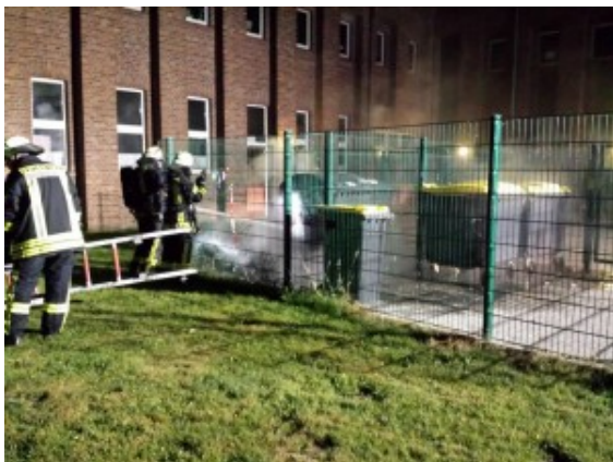
Containerbrand am Schacht IIIII.

In der Nacht zum Sonntag wurde die Feuerwehr Rünthe um 1.18 Uhr zu einem Containerbrand an der Begegnungsstätte Schacht III gerufen. Möglicherweise lag hier Brandstiftung vor.