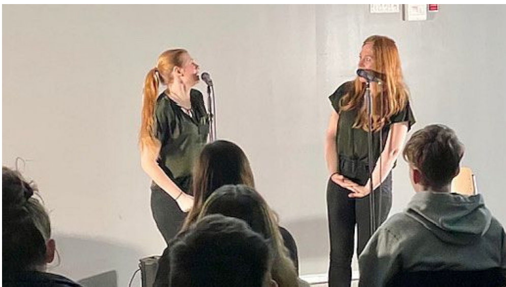
Aufklärungstheater „Brechreiz“ zum Thema Essstörungen.

Am Donnerstag fand für den gesamten 9. Jahrgang ein Aufklärungstheater mit dem Titel „Brechreiz“ an der Willy Brandt Gesamtschule statt, das von der Schulsozialarbeit organisiert wurde. Die finanzielle Unterstützung kam von der Mobil-Krankenkasse im Rahmen des Projektes „Bauchgefühl“. Ziel der Veranstaltung war es, die Schülerinnen und Schüler für das wichtige Thema ‚Essstörungen‘ zu sensibilisieren und aufzuklären.