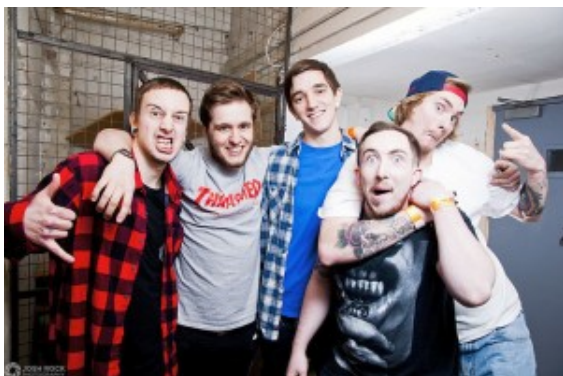
Giants aus UK

Standbein bildet das aus den Kursen der Jugendkunstschule hervorgegangene Band-Projekt MONSTARS GET LOADED.