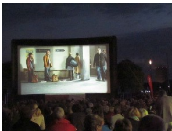
Open Air Kino in der Marina Rünthe

Das Kino Open Air des Bergkamener Kultursommers lockte am Dienstagabend über 500 Filmbegeisterte zum Hafenplatz der Marina Rünthe. Nach „Almanya“, und „Fasten auf Italienisch“ nimmt sich auch der französische Film „Le Havre“ des Themas Migration an.