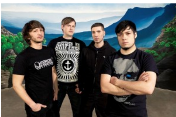
DISTANCE IN EMBRACE

Das Motto „Get Loud“ und eine ganze gitarrenjaulende Nacht beweisen: Es lohnt sich, für die Jugendkultur Krach zu schlagen! Der Eintritt zu dieser Veranstaltung ist frei! Die Anmeldung zum Fotoworkshop erfolgt am Veranstaltungstag vor Ort.