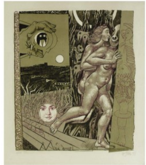
Grafik von Willi Sitte