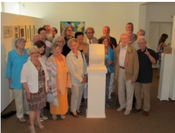
Künstlergruppe „Kunstwerkstatt sohle 1 Bergkamen“

„Wegmarke Torso“ heißt die Jahresausstellung der Künstlergruppe „Kunstwerkstatt sohle 1“, die am kommenden Sonntag, 15. September, zu Ende geht. Zu einer Finissage von 15 bis 17 Uhr in der städtischen Galerie „sohle 1“ mit Lesungen, Kurzfilm, Performance, gemeinsamem Rundgang und gemütlichem Plausch laden die Künstlerinnen und Künstler ihr Publikum herzlich ein.