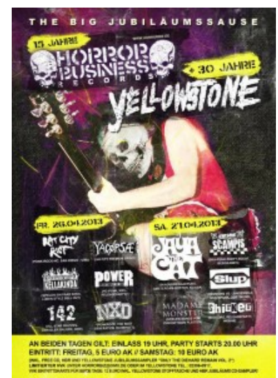
Plakat zur Doppeljubiläumsparty im Yellowstone

30 Jahre alt wird das Oberadener Jugendzentrum Yellowstone und das Selmer Label „Horror Business Records“ 15 Jahre. Grund genug, dies mit einer zweitägigen Geburtstagsfete am letzten April-Wochenende zu feiern.