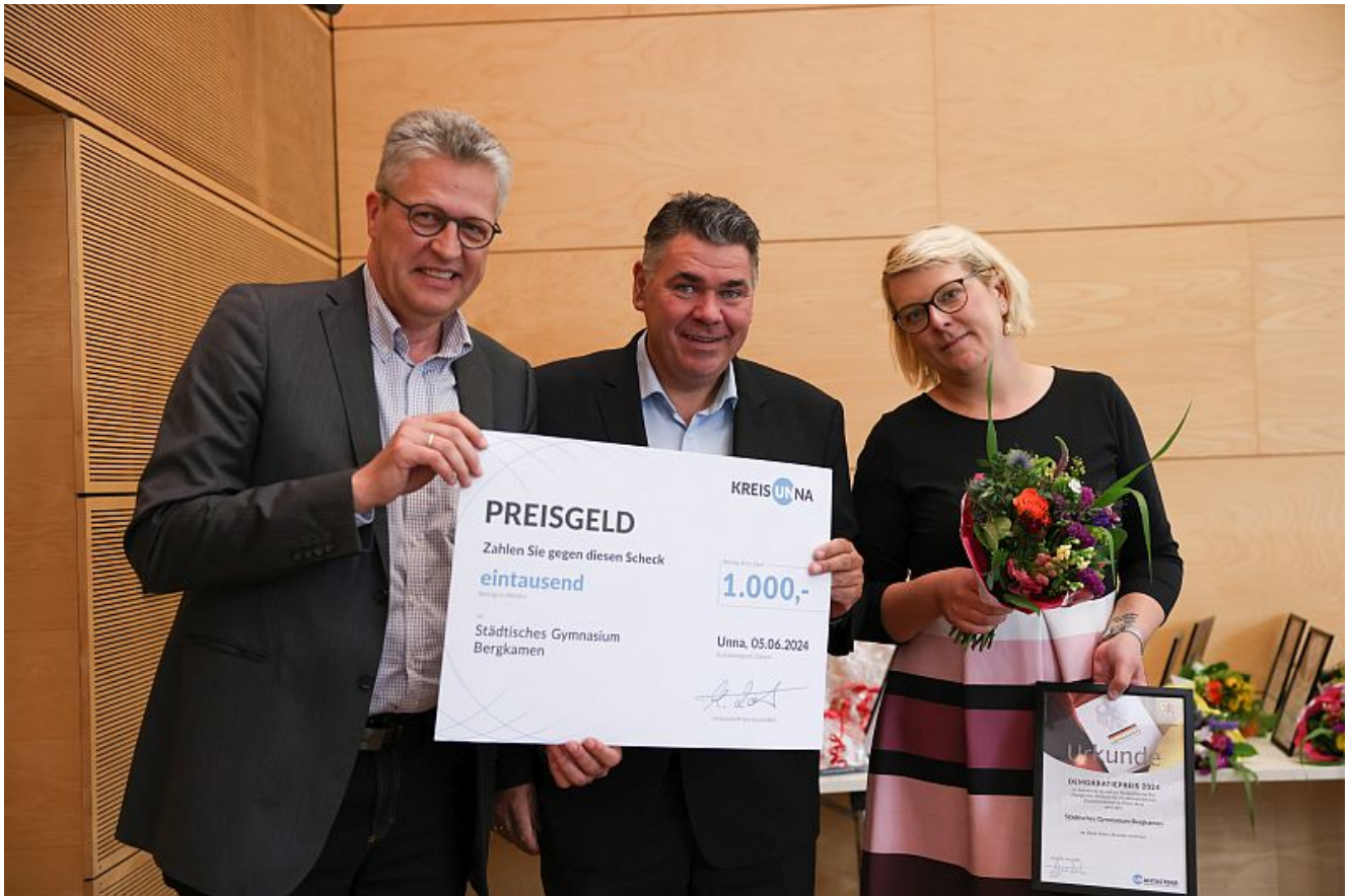
Preisträger Städtisches Gymnasium Bergkamen.

Die Demokratie lebt von engagierten Demokratinnen und Demokraten und ihren Initiativen und Projekten. Zu oft bleiben sie aber unsichtbar. Das will der Kreis Unna mit dem Kommunalen Integrationszentrum (KI) ändern und hat auf Initiative des Kreistags den Demokratiepreis ins Leben gerufen. Am 5. Juni ist er im Rahmen einer Feierstunde erstmals verliehen worden. Drei Gewinner haben je 1.000 Euro erhalten.