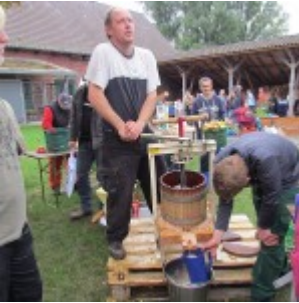
Apfelsaft aus der Applepresse