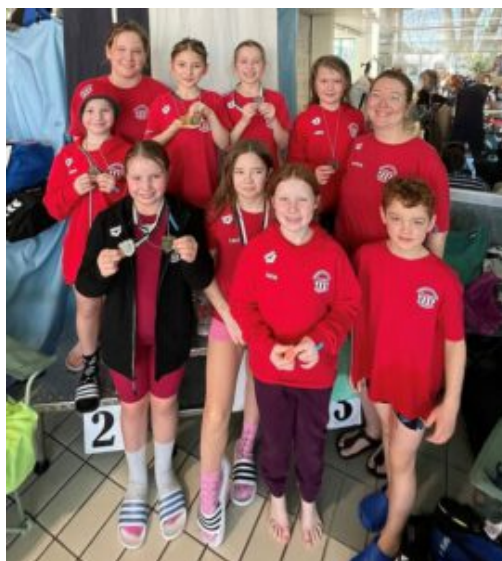
2. Mannschaft der RuRa-