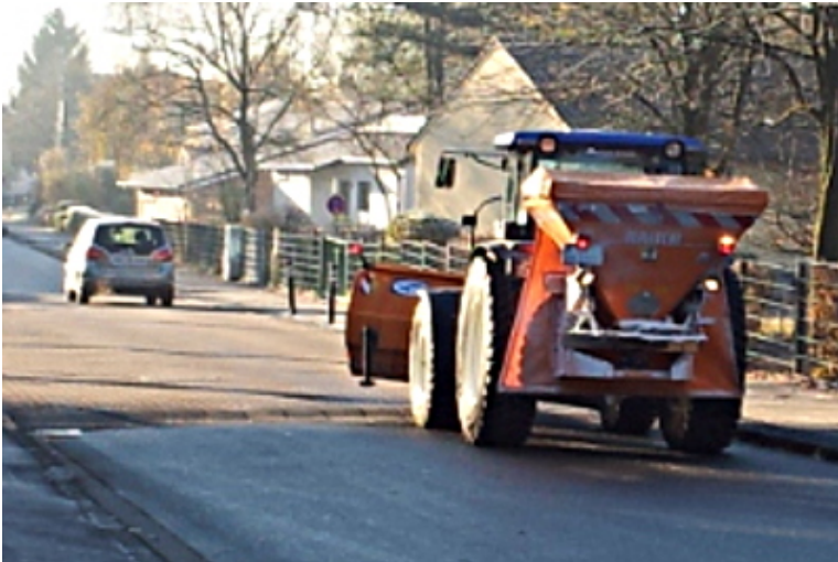
Streiffahrzeug auf der Pfalzstraße

Und dann ist er doch noch im Jahr 2013 gekommen: Am Dienstagmorgen musste der Entsorgungsbetrieb Bergkamen (EBB) seinen ersten Winterdiensteinsatz fahren.