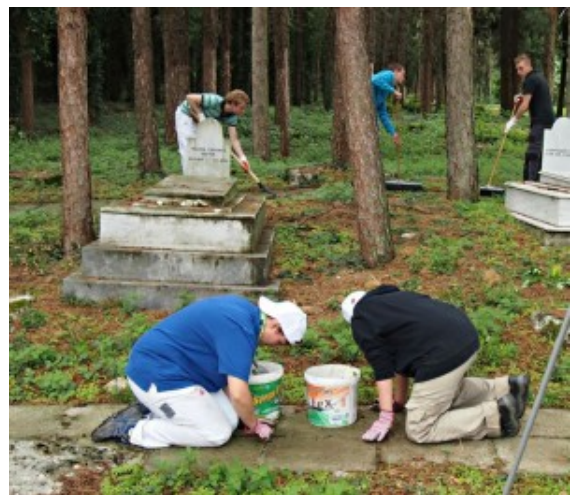
Arbeitseinsatz auf dem Jüdischen Friedhof in Griechenland.

Das Projekt „young workers for europe“ wird vom aktuellen forum nrw e.V. von 2012 bis 2014 durchgeführt. Das aktuelle forum mit Sitz in Gelsenkirchen ist nach dem Weiterbildungsgesetz des Landes NRW anerkannter Träger der demokratischen und politischen Erwachsenenbildung sowie anerkannter Träger der Jugendhilfe.