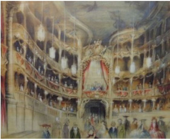
Die letzte Vorstellung im Hoftheater