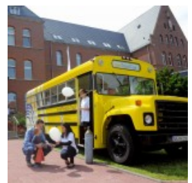
Der umgebaute gelbe Schulbus.

Zwei Gründe nennt Bürgermeister Roland Schäfer für diese Änderungen: Im September gebe es zu viele andere Veranstaltung und unter einem Dach sei man doch sehr wetterunabhängig.