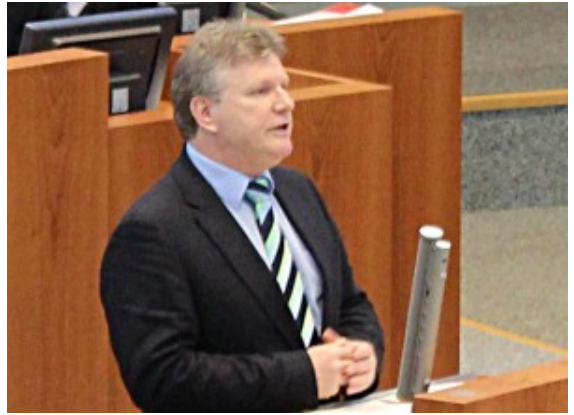
Landtagsabgeordneter Rüdiger Weiß

Im Dezember verabschiedete der Landtag in Düsseldorf eine zweite Revision des Kinderbildungsgesetzes. Bereits in der ersten Stufe war der Einstieg in die Gebührenfreiheit in Kitas und die Entlastung des Personals geschaffen worden. Nun werden im zweiten Schritt und im vorliegenden Entwurf die Kitas als Bildungsstandort gestärkt werden. Besonders Einrichtungen mit vielen sozial benachteiligten Familien sollen gefördert werden.