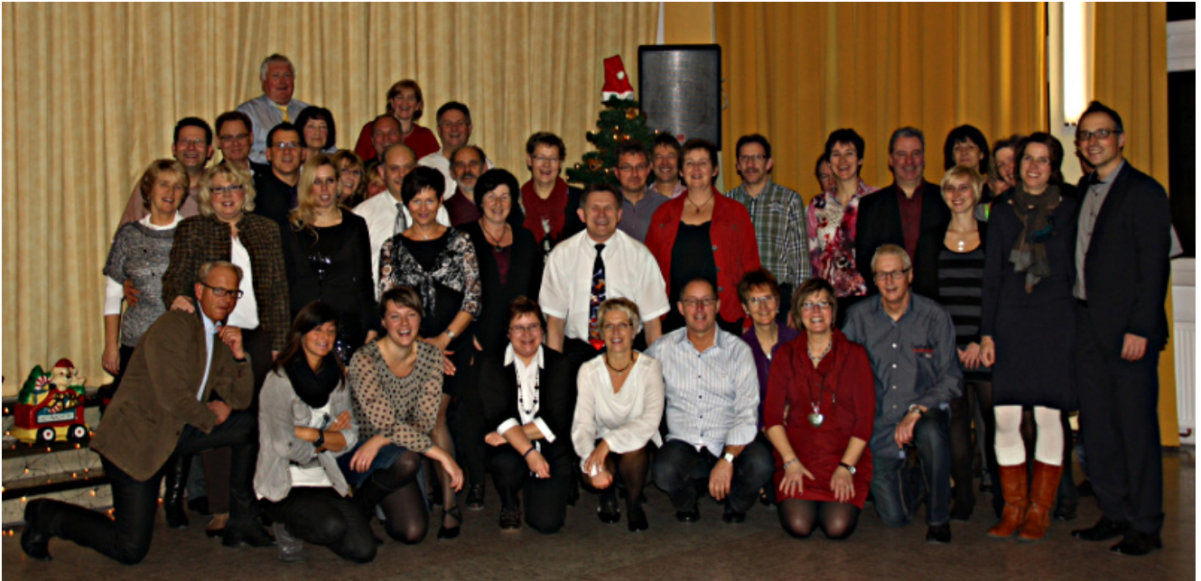
Die Teilnehmer der Tanzkurse der Friedenskirchengemeinde.

Neben weihnachtlichen Geschichten und Liedern, rockte der Nikolaus im Duett um den Weihnachtsbaum und die Tänzer mussten sich auf den Tanz nach Bethlehem begeben, allen eigentlich bekannt als Reise nach Jerusalem, nur diesmal tänzerisch. Vor allem das gesellige Beisammensein stand im Mittelpunkt und so feierte man bis spät in die Nacht.