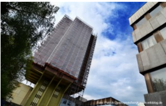
Der Wohnturm am 21.04.2014.

Das sind die letzten Bilder vom „ganzen“ Wohnturm. In den nächsten Tagen wird er immer kleiner werden.