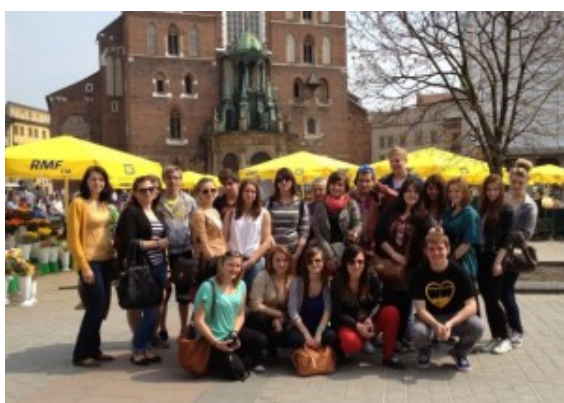
Gruppenfoto vor der Marienkirche in Krakau

Sichtlich erschöpft, aber mit vielen schönen Erinnerungen kehrten am vergangenen Sonntag zwölf Schülerinnen und Schüler des Städtischen Gymnasiums Bergkamen vom Austausch aus Bergkamens Partnerstadt Wieliczka in Polen zurück.