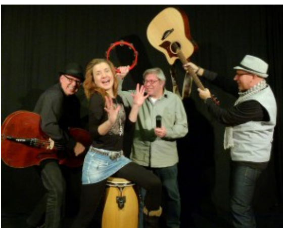
Das JuicyTones Quartett