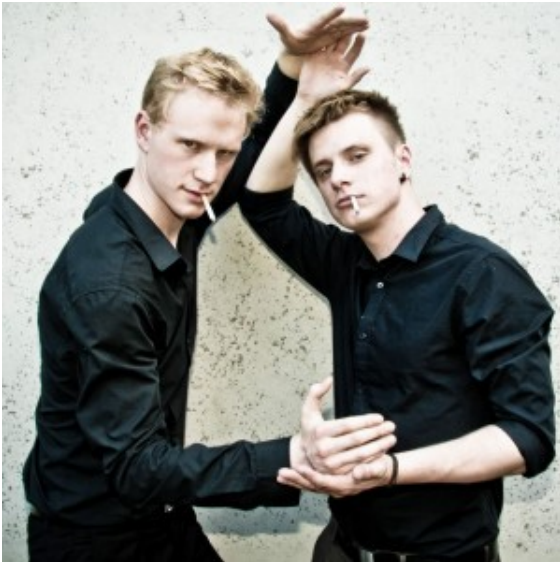
Team & Struppi

Team und Struppi stehen für preisgekröntes Anarchie-Kabarett aus Norddeutschland. Ihr erstes abendfüllendes Programm „Die Machtergreifung“ ist ein Rundumschlag der politischen Korrektlosigkeit, der alles und jeden trifft, ob nun Minderheiten oder die Regierung, Jesus oder das Publikum. Schamlos werden live auf der Bühne radikale Gesetze verabschiedet, unhaltbare Wahlkampfparolen zerpfückt und die Finanzkrise nach gespielt.