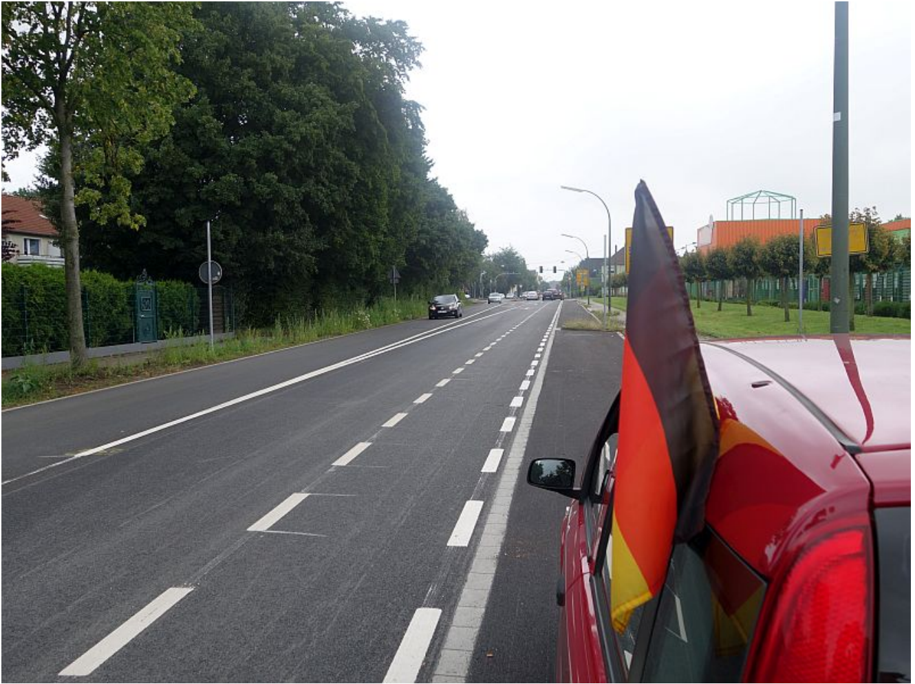
Freie Fahrt auf der Landwehrstraße.