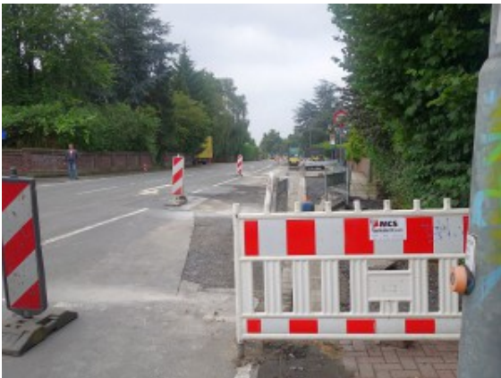
Restarbeiten auf der Landwehrstraße im Bereich der Kamer Heide.

Auch das Ende der zweiten Baustelle auf der Landwehrstraße ist absehbar. Die Baustellenampel ist dort, und nicht nur an der Kreuzung Werner Straße/Roggenkamp, wo es zu Aldi, Rewe, Globus und Co. reingeht, abgebaut, sondern auch im Bereich Einmündung