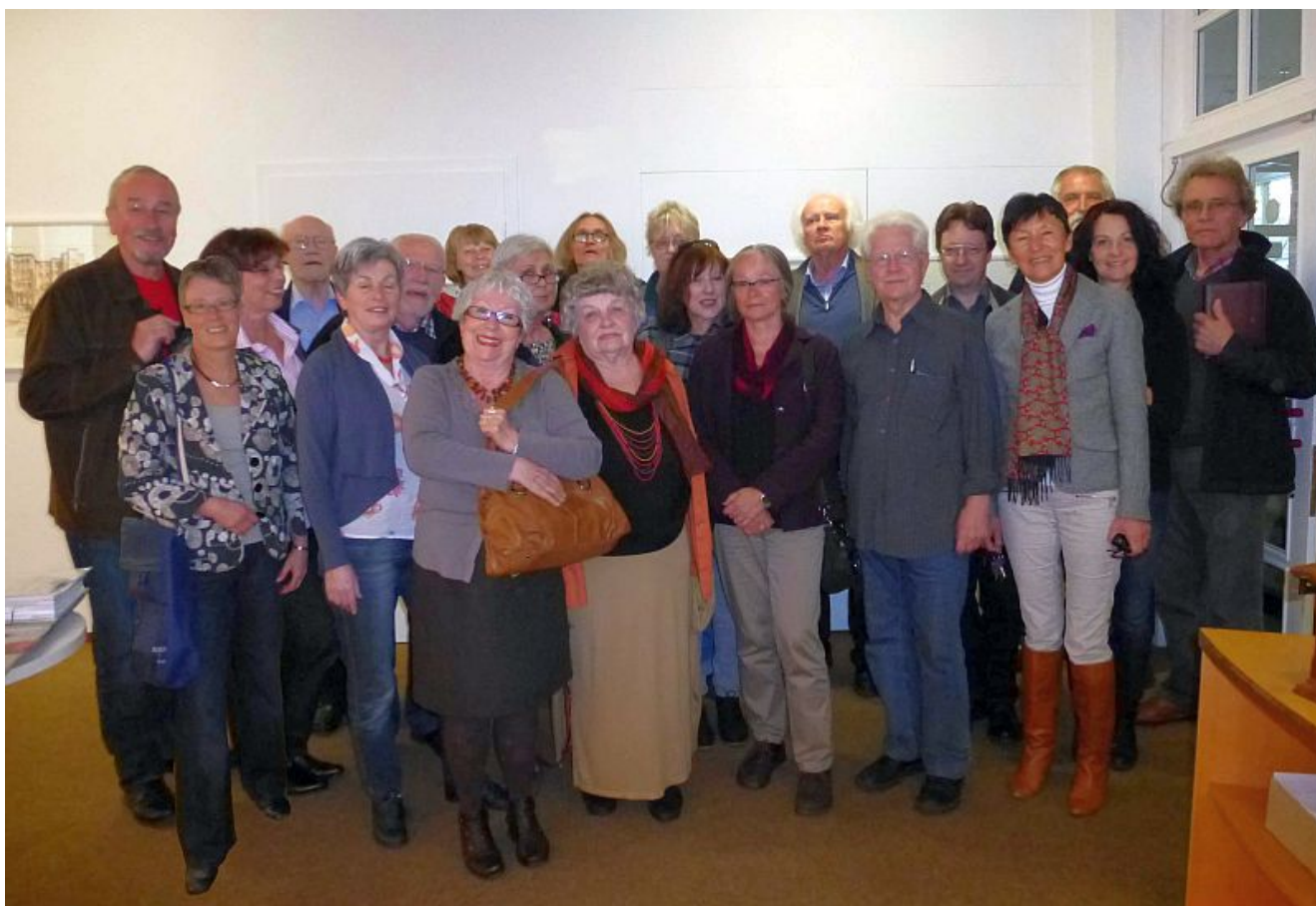
Bergkamener Künstlergruppe „Kunstwerkstatt sohle 1“

Der Traum steht im Mittelpunkt der neuen Jahresausstellung der Künstlergruppe „Kunstwerkstatt sohle 1“. Mit einem vielfältigen künstlerischen Eröffnungsprogramm lädt die Gruppe alle Kunstinteressierten am Sonntag, 22. Juni um 11.00 Uhr in die städtische Galerie „sohle 1“ herzlich ein.