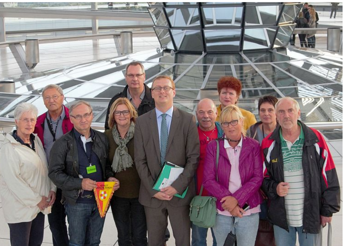
Ehrenamtliche von TuRa Bergkamen mit dem Bundestagsabgeordneten Oliver Kaczmarek.

Auf Einladung des heimischen Bundestagsabgeordneten Oliver Kaczmarek war eine Gruppe engagierter Bürgerinnen und Bürger aus Bergkamen in der vergangenen Woche für drei Tage zu Gast in Berlin. Die Teilnehmerinnen und Teilnehmer sind bei TuRa Bergkamen ehrenamtlich aktiv.