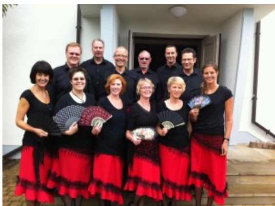
Die Dancers Formation.

Beim Open-Air-Theater im Kultursommer am morgigen Freitag im Wasserpark wird im Vorprogramm ab ca. 19:30 Uhr die AK-Dancers Formation mit einer Paso Doble-Vorführung auftreten.