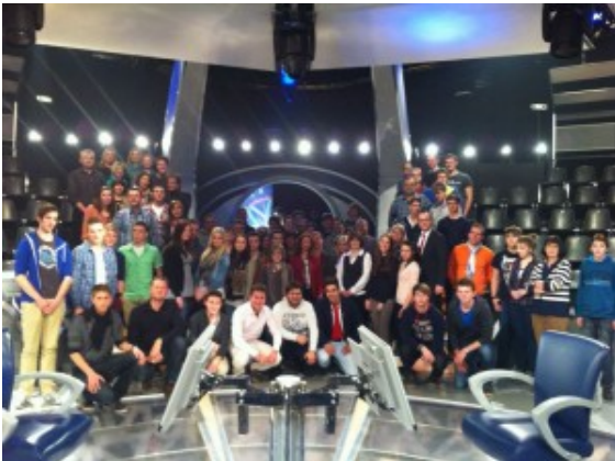
Teilnehmer des Planspiels Börse im Kölner RTL-Studio.

sensibilisiert für Finanzthemen, mit dem Ziel, die Jugendlichen und jungen Erwachsenen zu einem verantwortungsvollen Umgang mit Geld zu erziehen“, sagte Michael Krause. Zu den Gewinnern der diesjährigen Runde zählten sowohl in der internen Institutswertung als auch in der Nachhaltigkeitsertragswertung die „Humboldt-Realschüler“ aus Bönen. Die Gruppe „ ALLAK“ des Städt. Gymnasiums Bergkamen landet in der Depotswertung auf Rang zwei.