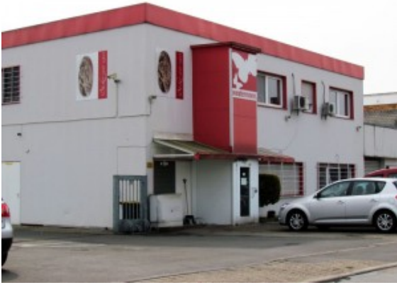
Bäckerei Westermann in Oberaden.

Das sei ohne Beteiligung des Betriebsrats geschehen, kritisiert der Sekretär der Gewerkschaft Nahrung-Genuss-Gaststätten (NGG). Und: „Maschinen und Ausstattungen aus Bergkamen werden offensichtlich derzeit abtransportiert“, erklärt er. Ziel sei möglicherweise Dortmund-Hörde, dem ehemaligen Sitz der Bäckerei Feldkamp.