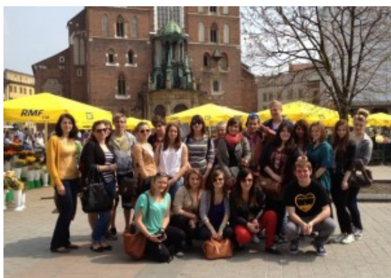
Gruppenfoto vor der Marienkirche in Krakau

Sichtlich erschöpft, aber mit vielen schönen Erinnerungen kehrten am vergangenen Sonntag zwölf Schülerinnen und Schüler des Städtischen Gymnasiums Bergkamen vom Austausch aus Bergkamens Partnerstadt Wieliczka in Polen zurück.