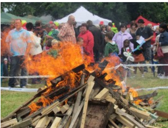
Johannisfeuer 2013 in Weddinghofen.