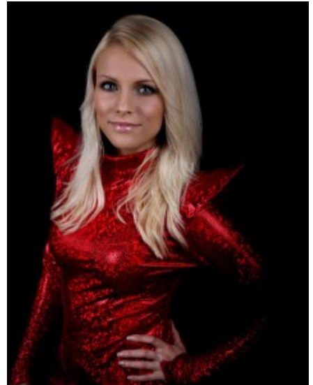
Mara – Best of Helene

„Atemlos durch die Nacht“. Mit einer professionellen Bühnenpräsenz sowie der perfekten Optik erleben sie das „Helene“- Gefühl mit allen vergangenen und aktuellen Hits der Schlagerprinzessin. 100% Live gesungen!