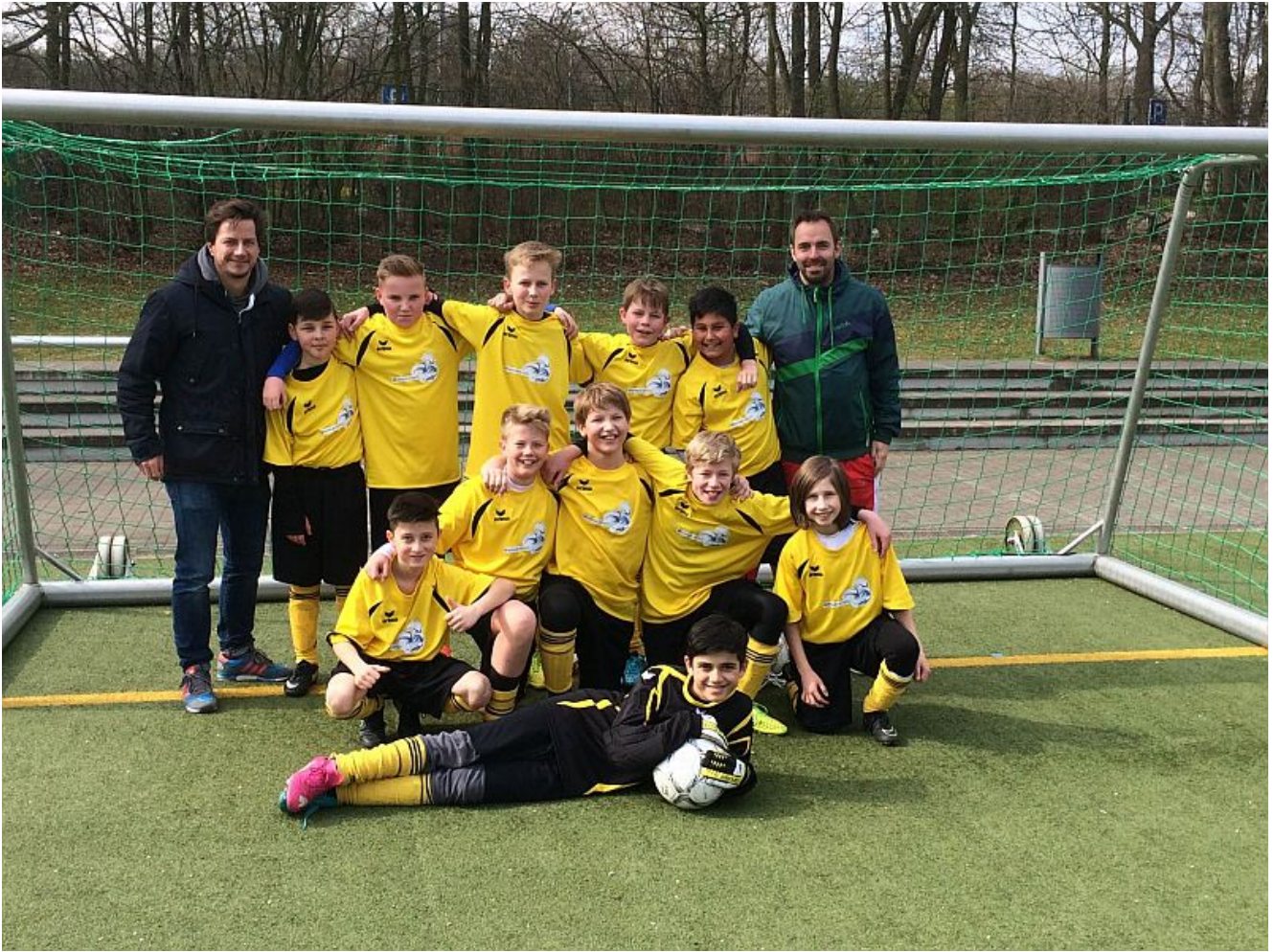
Das WK IV-Team des Bergkamener Gymnasiums.

Weitere Finalisten stellten das Ernst-Barlach-Gymnasium Unna, das Freiherr-von-Stein-Gymnasium Lünen sowie die Realschule aus Kamen.