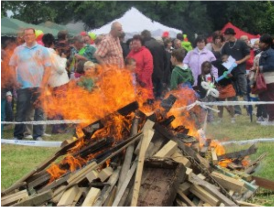
Johannisfeuer 2013 in Weddinghofen.

Auch die Jahreshauptversammlung im Alevitischen Kulturzentrum wurde vom „runden Leder“ bestimmt. In gut einer Stunden waren die üblichen Formalien nebst Vorstandswahlen und Terminplanung erledigt gewesen. Die BVB-Fans drängte es zu den Fernsehapparaten. Weischedes Prophezeiung, dass die terminliche Überschneidung von Vereinsversammlungen und wichtigen Fußballspielen stets das gewünschte Ergebnis bringen würden, sollte dann später in Erfüllung gehen.