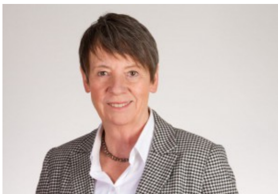
Barbara Hendricks.

Bundesumweltministerin Barbara Hendricks ( SPD ) ist prominenter Gast der Bergkamener Kundgebung zum 1. Mai am kommenden Freitag in der Römerberg-Sporthalle. Die Kundgebung beginnt dort um 11 Uhr.