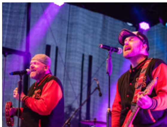
„Burning Heart“ bringt die Menge zum Kochen.

Es gab aber auch besinnliche Momente. Etwa bei der Taufe des „Roten Johannes“, dem neuen Boot der DLRG. Nach über 30 Jahren hatte das alte Schiff unwiderruflich ausgedient. GSW und Stadt steuerten zu der Anschaffung eines neuen Exemplars bei, damit vor allem in der Marina alle sicher unterwegs sein können. Eingeweiht wurde das neue Boot gleich vor Ort mit einem christlichen Kurzgottesdienst, Segnung, klassischer Bootstaupe durch Bürgermeister und GSW-Chef und der Jungfernfahrt mit anschließenden Rundfahrten. Auch der Tauchcontainer bot entschleunigende Anblicke beim Auftritt der „Mermaids“, die mit Meerjungfrauenflosse elegant an den Scheiben vorbeiglitten oder DLRG-Retter, die in aller Ruhe mit voller Tauchausrüstung eine Bergung bewältigten.