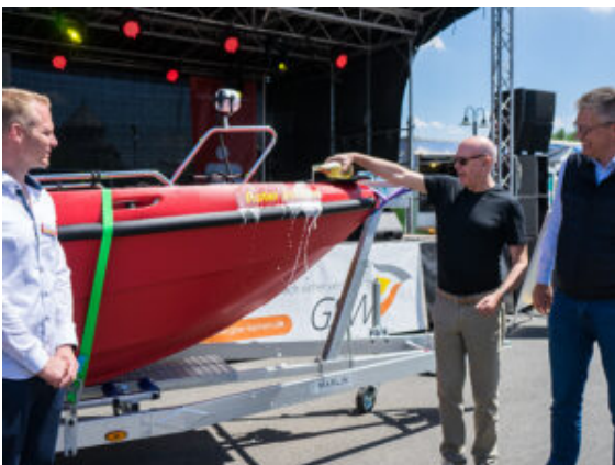
Schiffstaupe vor der Hafenmeisterei.