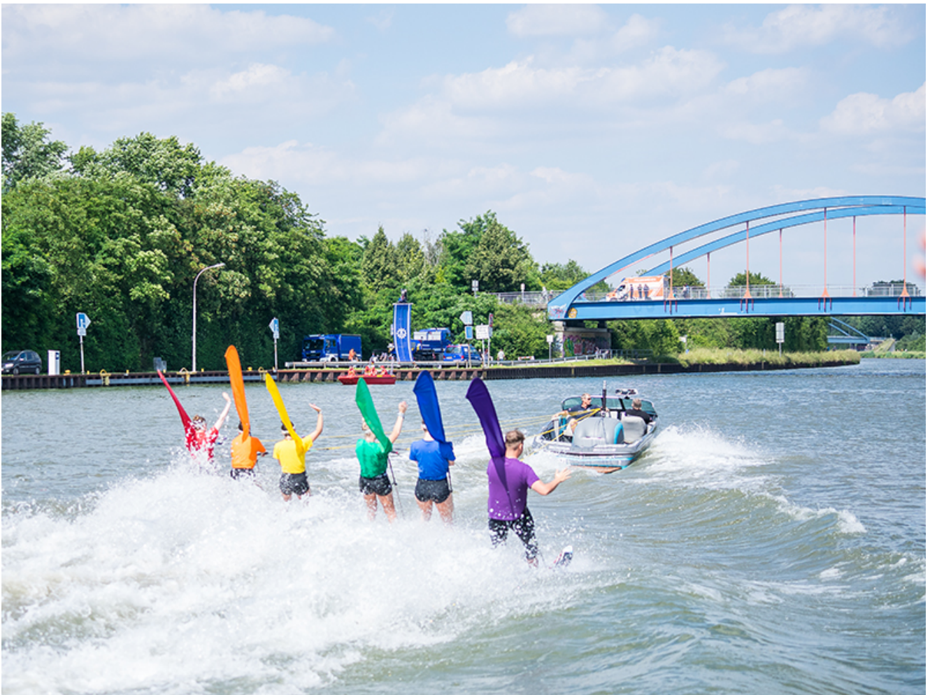
Farbenfrohe Formation bei der Wasserski-Show auf dem Kanal.