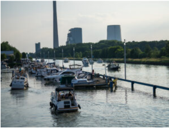
Die Boote bei der Einfahrt in die Marina.

bieten, was zu einem fast sommerlich-maritimen Festauftakt gehört. Die Sonne gab jedenfalls alles und bot eine farbsatte Kulisse mit stattlichem Sonnenuntergang bei deutlich erwärmten Temperaturen. Endlich kamen T-Shirts und Sandalen zum Einsatz, auch für ein spontanes Tänzchen direkt vor der Bühne.