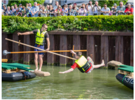
Action beim Fischerstechen im Hafenbecken.

Das Fischerstechen hat immer noch seinen Reiz: Acht Mannschaften traten beim Balanceakt auf der Rampe an der Bootsspitze mit gepolsterten Lanzen gegeneinander an. Das Flying Board war heiß begehrt, um sich mit gewaltigen Wasserdüsen in die Höhe zu schießen. Die Powerboote auf der anderen Hafenseite waren schon fast zu schnell, um ihnen mit dem bloßen Auge zu folgen. Auch in der Kinderunterhaltung ging es ganz schön rasant zu. Mit Bungee-Seilen schossen die Kinder unablässig in die Höhe, feuerten Bälle im Piratennest aus der Kanone ins Ziel oder tanzten sich mit den Akteuren auf der Bühne klitschnass im Takt nass.