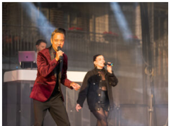
Musik und Tanz samt DJ gab es auf der Hauptbühne.

Der Fahrradparkplatz war schon fast bis an die Kapazitätsgrenze gefüllt. Auch zu Fuß strömten unablässig die Besucher Richtung Hafensperrmauer. Ganze Pilgerscharen waren auf allen Straßen rundherum unterwegs. Mit Kinderwagen und Hunden an der Leine ging es auf die beiden Plätze der Marina, wo sich der Sommer endlich mal wieder von seiner überaus freundlichen Seite zeigte. Ein gelungener Auftakt für das, was noch zwei Tage lang folgen soll.