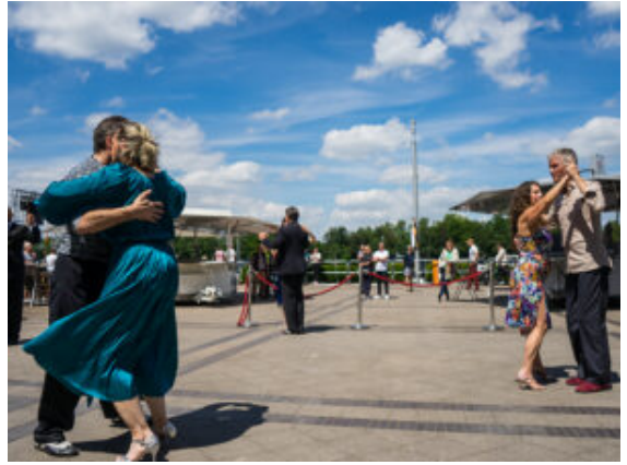
Hingebungsvolle Tango-Tänzer am Marina-Ufer.

Charmant war auch das, was sich im Innenhof des Hafencafés abspielte. Hier drehten sich mehrere Tanzpaare zu argentinischen Tangoklängen engumschlungen auf dem Marina-Pflaster. Ganz ähnlich, wie es in vielen Städten Trend ist: Romantisches Tanzvergnügen direkt am Wasser. Deutlich flotter ging es auf der Bühne der Hafenmeisterei zu. Hier zeigten die Tänzerinnen und Tänzer von „Dancers Home“, wie viel Akrobatik und Lebensfreude Choreografien zu aktuellen Hits zu bieten haben. Direkt dahinter erlebten die Reservisten der Bundeswehr ein ganz neues Interesse. Die aktuelle Weltlage und insbesondere die politische Diskussion in Europa über Wehrfähigkeit und Aufrüstung zog auch angesichts der Europawahl viele Interessierte an den Stand.