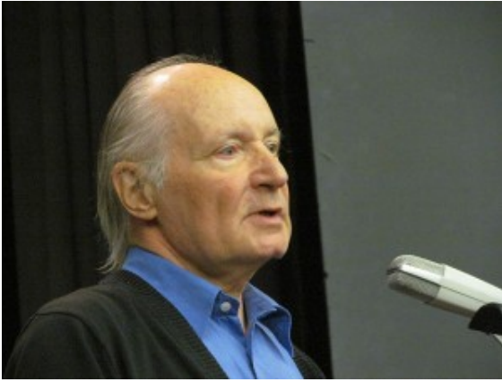
Eugen Drewermann im Bergkamener studio theater.

Die Kindheitserlebnisse der Bombenangriffe 1944 und im Frühjahr 1945 auf Bergkamen haben sein späteres Leben entscheidend geprägt. Miterleben musste auch die Not, die durch das Grubenunglück 20. Februar 1946 auf der Schachanlage Grimberg \frac{3}{4} zusätzlich verschärft wurde. Sein Vater arbeitet auf dieser Schachanlage, befand sich aber nicht in der Schicht, die durch die verheerende Schlagwetterexplosion betroffen war.