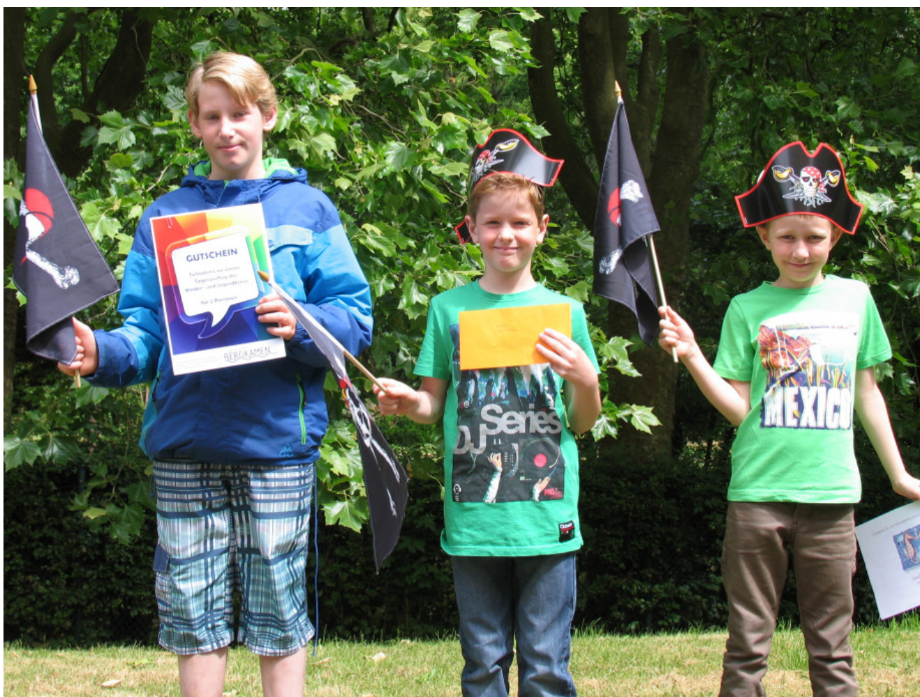
Die Gewinner der Hafenfest-Schatzsuche

Mit großem Erfolg hat die Stadtverwaltung Bergkamen beim Hafenfest 2015 eine Schatzsuche für Kinder über das gesamte Hafenfestgelände durchgeführt. Mehr als 250 Kinder haben mit Begeisterung den Schatz der Marine Rünthe gefunden.