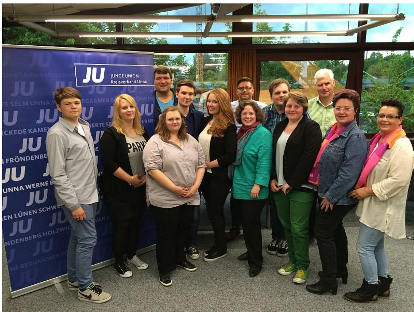
Der neue Vorstand der JU Bergkamen.