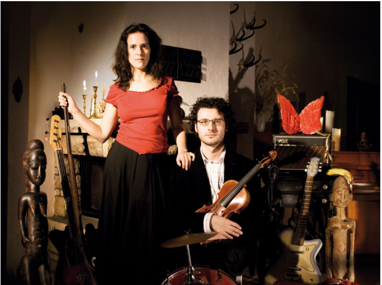
Duo „Cats'n fruits“

Auch wenn es am Freitag, 14. August, schütten sollte, findet das Konzert mit dem Musikduo „Cats'n fruits“ in jedem Fall statt – und zwar ab 19 Uhr in der städtischen Galerie „sohle 1“. Bleibt es trocken, bleibt es auch beim ursprünglichen Veranstaltungsort, der Arena im Römerpark Bergkamen.