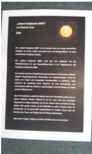
Plakat des Kulturreferats zum „subport bergkamen“