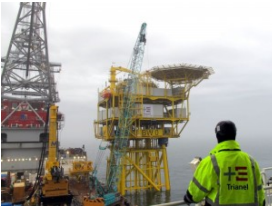
Bau der Umspannplattform

Gern würden die Gemeinschaftsstadtwerke Ökostrom mit Windkraftanlagen auf der Bergkamener Bergehalde „Großes Holz“ produzieren. Bis es soweit ist, kann es aber noch eine Weile dauern. In der Nordsee ist das kommunale Versorgungsunternehmen schon etwas weiter. Die GSW sind dort am Bau eines Windpark beteiligt.