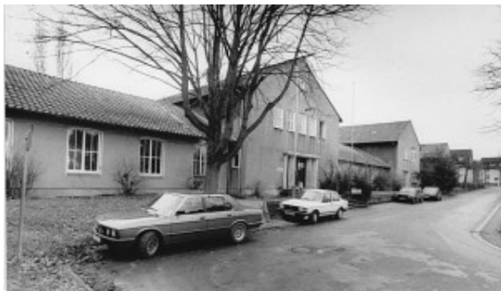
Die Gebäude des ehemaligen Bergbaujugenddorfs an der Stormstraße in Oberaden.

Das erste Berglehrlings-Heim wurde in Oberaden im Dezember 1949 im Bereich Sundern eröffnet, ein zweites, wesentlich größeres 1953 am Südrand der Römerberg-Siedlung an der heutigen Stormstraße. „Aufgabe der Lehrlingsheime und der in ihnen tätigen erfahrenen Erzieher und Gruppenleiter war es, den Auszubildenden, die während ihrer Lehrzeit fernab von Heimat, Familien und Eltern leben mussten, umfassende Geborgenheit und ein Zuhause mit familiären Charakter zu bieten“, berichtet Stadtarchivar Litzinger. Dies geschah ab 1951 in enger Zusammenarbeit mit dem Hilfswerk „Christliches Jugenddorfwerk Deutschland“ mit Sitz im Stuttgart.