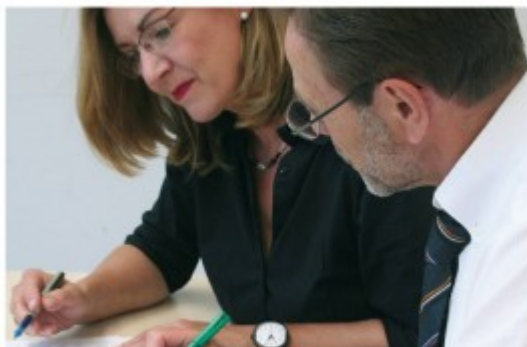
Qualitätsanalyse Nordrhein-Westfalen Impulse für die Weiterentwicklung von Schule

Das geschieht auf der Homepage des Städtischen Gymnasiums. Den Link gibt es der Einfachheit halber hier. Dazu gibt es auf der Downloadseite des Gymnasiums eine Powerpoint-Präsentation mit den wesentlichen Inhalten des Berichts zur Qualitätsanalyse.