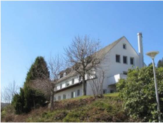
Der ältere Teil des Hauses Monopol in Willingen.

Männer, die aus ganz Deutschland kamen, wohnten zum Beispiel im Jugenddorf in Oberaden oder im Pestalozzidorf in Weddinghofen. Durch eine besondere Betreuung versuchten die Zechengesellschaften, die Probleme, die durch die Trennung von den Familien entstanden sind, auszugleichen.