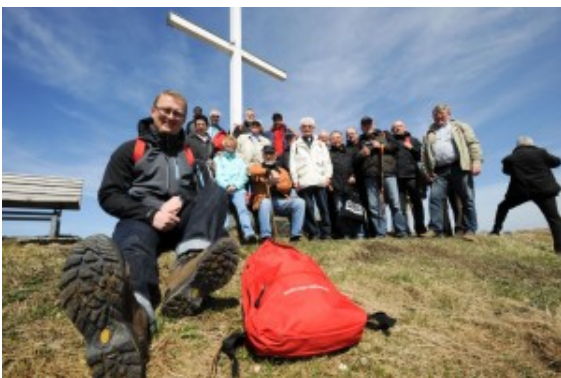
Oliver Kaczmarek und die IG BCE-Mitglieder aus Kamen

Auch nicht 1972, als der heutige Bundestagsabgeordnete Oliver Kaczmarek dort mit seiner Familie zum ersten Mal einen Winterurlaub verbrachte. Vermutlich würde er sich daran gar nicht erinnern, wenn es davon nicht Amateurfilmaufnahmen gäbe.