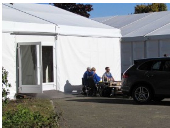
Das Aufnahmezelt von außen.

Ändern könnte sich das, wenn das eigene Lager für Verbrauchsmaterialien funktionsfähig ist. Dafür sind bereits die Räume des inzwischen ebenfalls geschlossenen Getränkemarkts neben dem Ex-Aldi in Weddinghofen angemietet worden. Dort soll dann auch eine zentrale Spendenannahmestelle eingerichtet werden.