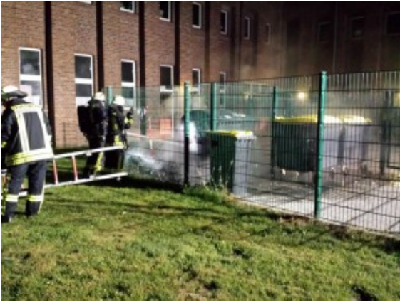
Containerbrand am Schacht IIII.

Eine Streife der Polizei bemerkte das Feuer und den Qualm und alarmierte sofort die Feuerwehr. Als die Löschgruppe Rünthe mit drei Fahrzeugen und 15 Feuerwehrleuten an der Einsatzstelle eintraf, brannte bereits ein weiterer Container. Das Feuer wurde unter Atemschutz und einem Strahlrohr abgelöscht. Die Container befanden sich in einem eingezäunten Areal mit einem ausreichendem Sicherheitsabstand zum Schacht III.