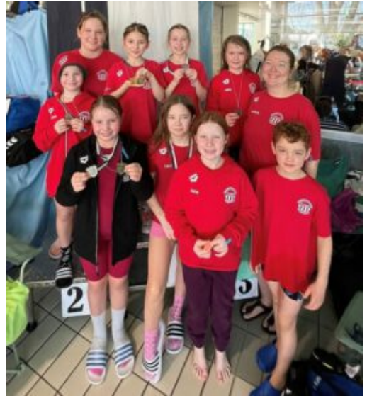
2. Mannschaft der RuRa-Serreunde.

Am ersten Februarwochenende waren die Schwimmer:innen der Wasserfreunde TuRa Bergkamen bei zwei Wettkämpfen im Einsatz – trotz vieler krankheitsbedingter Ausfälle zeigten sie starke Leistungen.