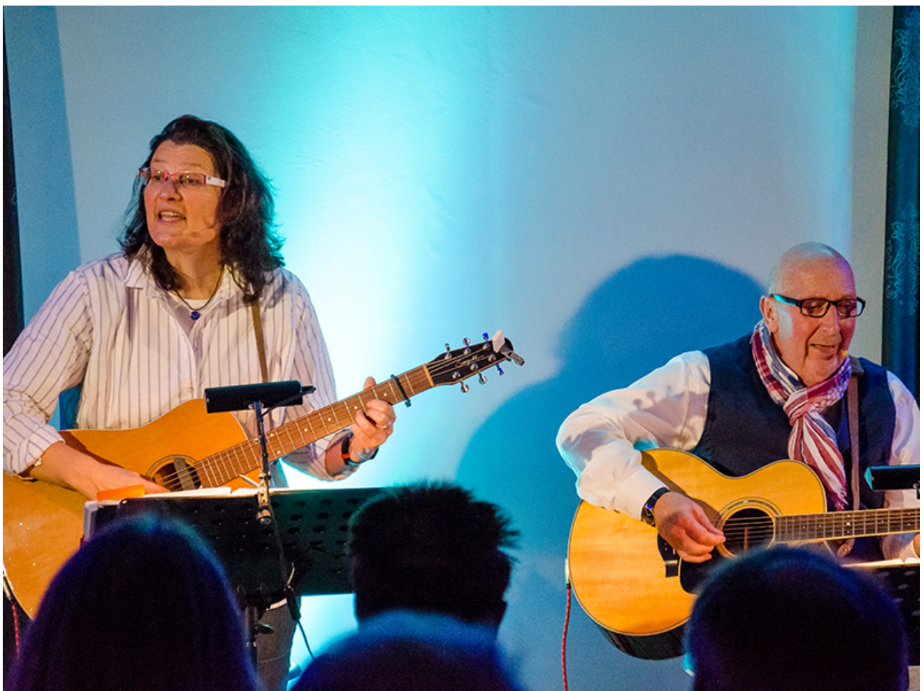
Das Duo „Mondi di Notte“.