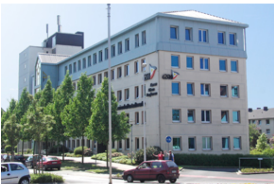
GSW-Gebäude in Kamen.

Die GSW erhalten derzeit wieder vermehrt Hinweise von ihren Kunden, dass sich fremde anrufer als GSW-Mitarbeiter ausgeben und persönliche Daten abfragen.