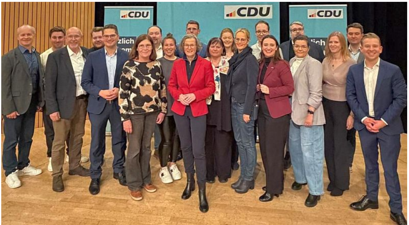
Der neue CDU-Kreisvorstand.

Am 17. Dezember führte der CDU-Kreisverband Unna seinen turnusgemäßen Kreisparteitag mit Vorstandswahl durch. Über 100 Delegierte aus allen zehn Kommunen des Kreises Unna trafen sich im Lüner Hansesaal, um eine lange Tagesordnung abzuarbeiten.