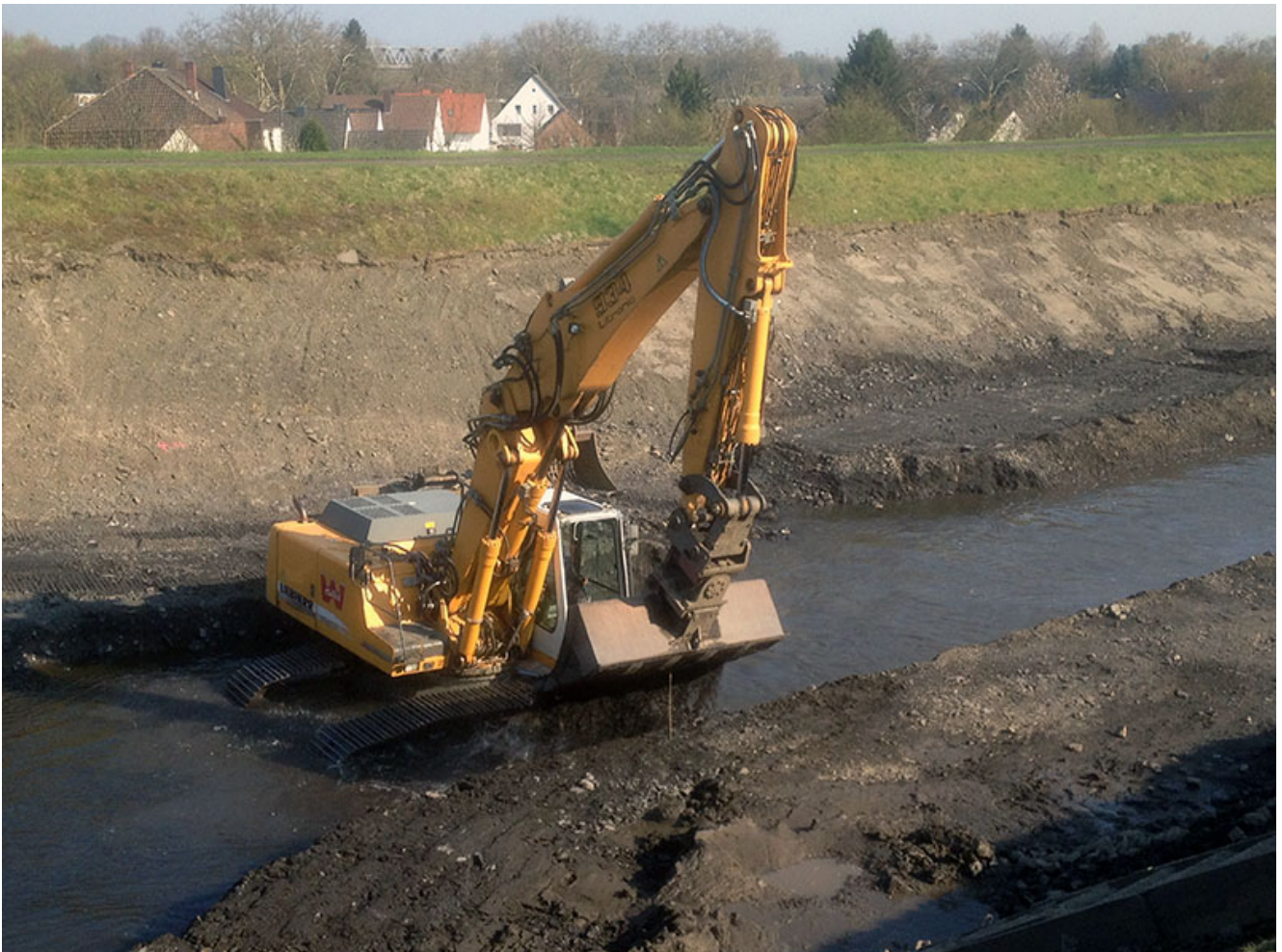
Bagger im Unterlauf der Seseke

Die Umgestaltung der Seseke geht in den Endspurt: Nachdem der ehemalige Schmutzwasserlauf in Bönen, Kamen und Bergkamen bereits renaturiert ist, wird zuletzt der Unterlauf des Gewässers in Lünen ökologisch verbessert. Aktuell laufen Arbeiten für die „neue Seseke“ zwischen dem A Sternweg und dem Dattel-Hamm-Kanal.