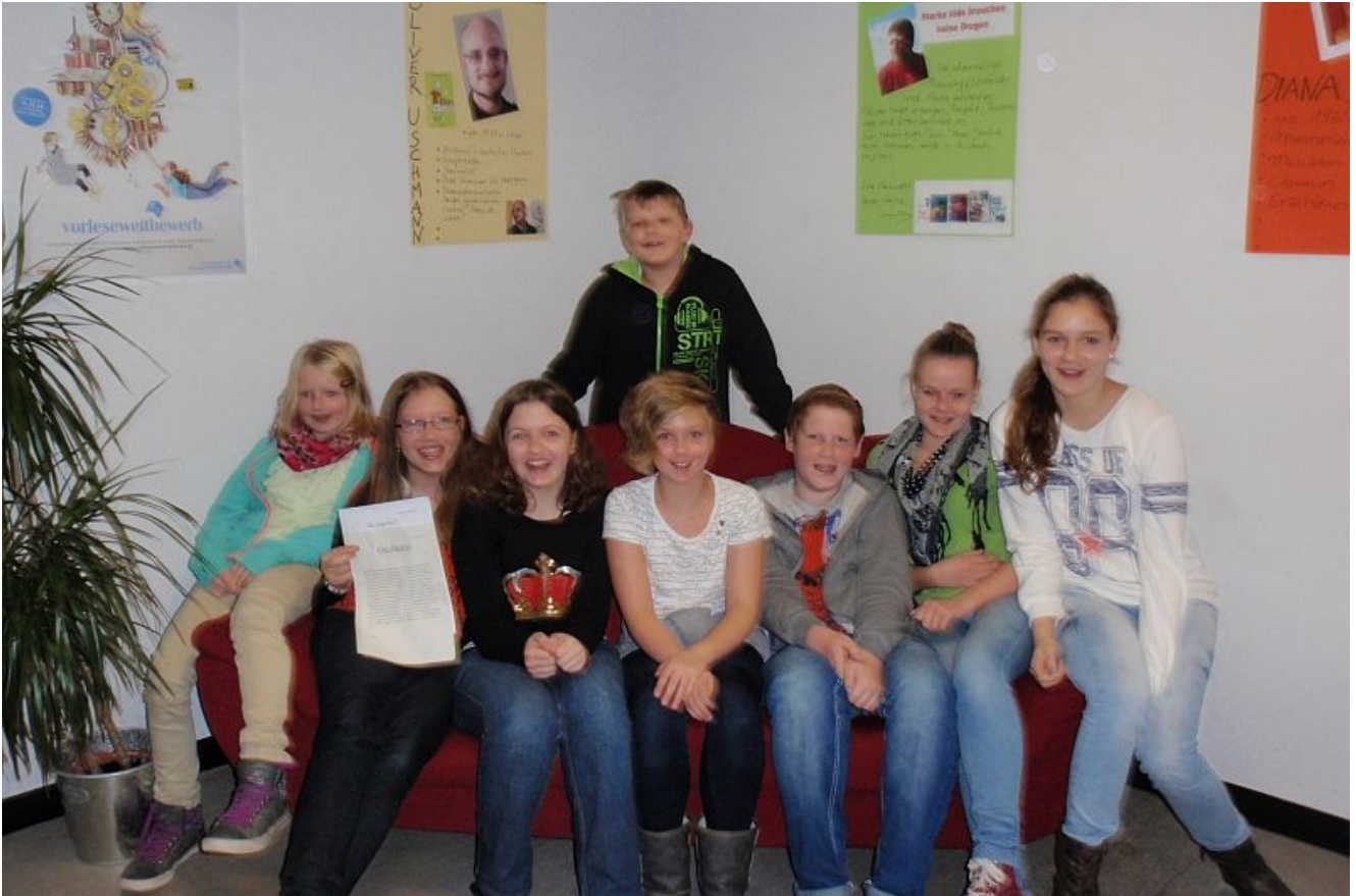
Die Teilnehmer am Poetry Slam.