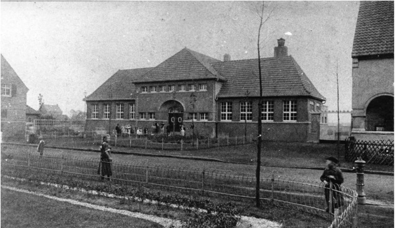
Historisches Foto vom Wohlfahrtsgebäude in der Siedlung Schönhausen.

Der 27. Januar ist seit 1996 der Tag des Gedenkens an die Opfer des Nationalsozialismus. An diesem Tag im Jahr 1945, der sich jetzt zum 70. Mal jährt, befreite die Rote Armee das KZ Auschwitz, das als Synonym für die Ermordung von sechs Millionen Juden durch das NS-Regime gilt.