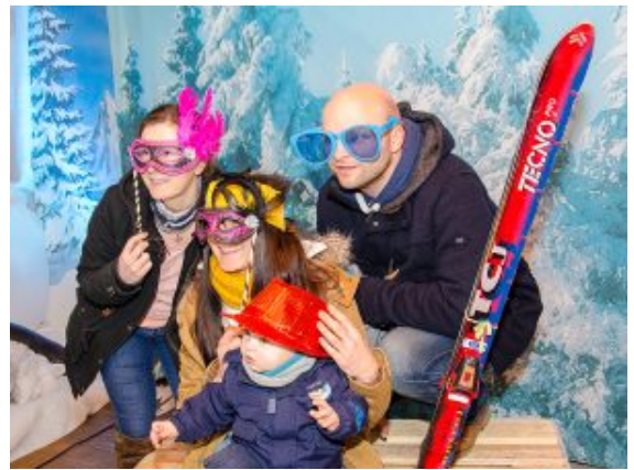
Fotospaß im winterlich-surrilen Outfit in der Kinder-Winterwelt.