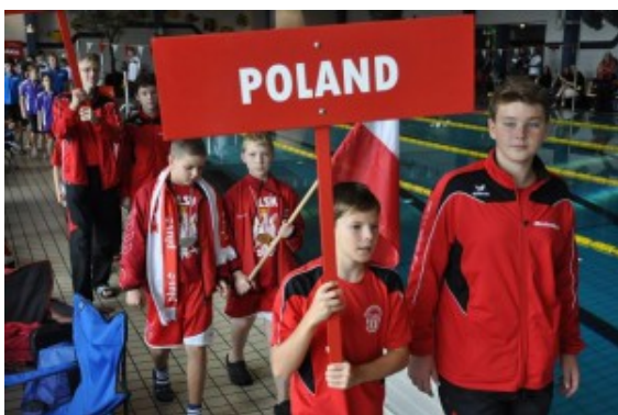
Einzug der Nationen 2014

Mit großer Erwartung fiebern die Wasserfreunde TuRa Bergkamen ihrer Großveranstaltung, dem 41. Internationalen Schwimmfest am 19. und 20. September entgegen. Gemeldet sind insgesamt 18 Vereine mit 260 Aktiven bei 1.350 Starts.